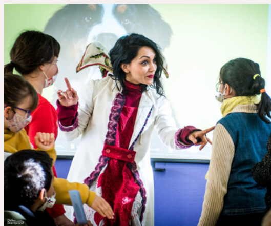
Voyage Initiatique autour des sentiments