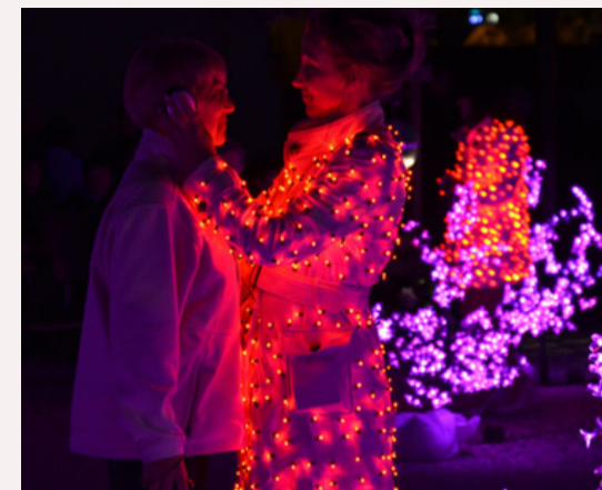
Embruns de lune