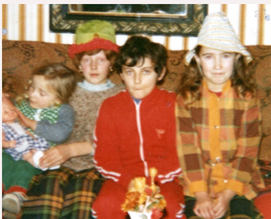
Au bout de la mer et se souvenir