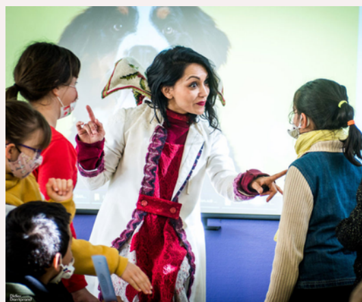
Voyage Initiatique autour des sentiments